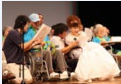
↑歌や踊りなど、練習の成果を精一杯に披露する出場者の皆さん

一輪車の運動会として広く知られている『一輪ピック』が、5月24日に波多津小学校で開催されました。23回目を迎える今回は、同校児童73人のほか、市内の小学校や鳥栖市、福岡県春日市などから小