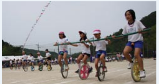
→4人のチームワークでゴールをめざす『棒リレー』

他の学校や違う学年の子と4人ずつチームを組んで一本の竹棒をリレーする『棒リレー』では、転倒したメンバーをかばいながら力を合わせてゴールをめざしました。この日の開会式で、緒方克成校長の「1人でもいいから、