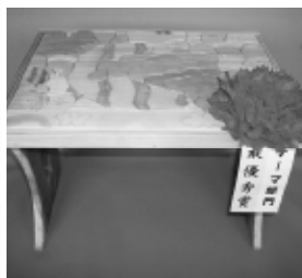
(写真) 昨年度のテーマ部門『おいしい楽しい』最優秀作品