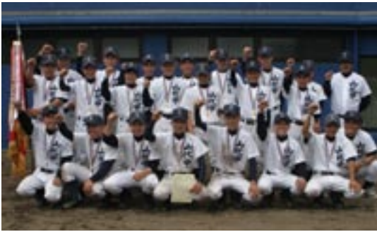
↑接戦を制して優勝を果たし、喜びの山代中ナイン

点を挙げました。その1点を全員で守りきった山代中が優勝を果たしました。 優勝 山代中学校 準優勝 啓成中学校