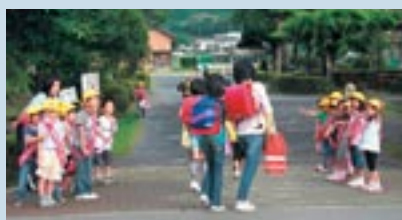
↑ 二里小学校のあいさつ運動

毎朝、明るく元気よく、自分から「おはよう」と言ってみましょう。そうすれば、言われた相手も元気になる、言った自分もすがすがしい気持ちで一日がスタートできますよ。