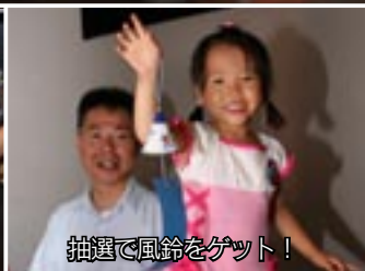
抽選で風鈴をゲット!