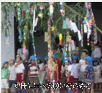
短冊に星への願いを込めて

七夕は、旧暦7月7日の 行事でした。明治時代に新 暦が採用されたので、現代 では、7月7日から8月7日 に行われます。この日に天 の川をはさんだ織姫（織女 星）と彦星（牽牛星）が、 あうことを祝う星祭りとさ