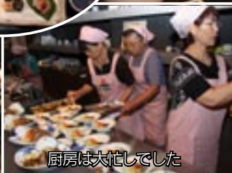
厨房は大忙しでした