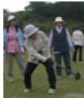
↑狙います！ホールインワン