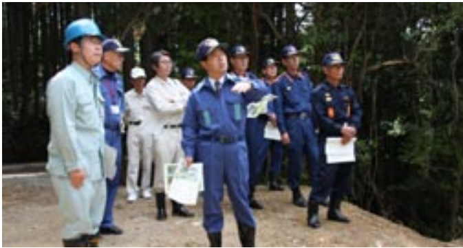
→大川町川西地区の山林崩壊個所で防災パトロールを実施する関係者

本格的な雨期を前にした5月25日、市は伊万里土木事務所、伊万里農林事務所、警察、消防団などと合同で防災パトロールを実施し、災害発生のおそれがある危険個所の点検などを行いました。