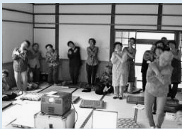
↑勉強会に合間に『せせらぎの会』の皆さんが参加しました。