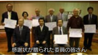
感謝状が贈られた委員の皆さん

この日、長年にわ たり企画や運営に従 事してきた実行委員 など13人に對し、市 の美術文化の発展に 貢献されたとして、