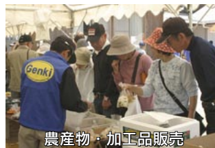
農産物・加工品販売