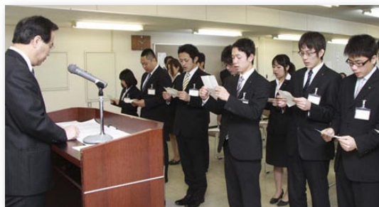
↑ 塚部市長(左)に宣誓を行う新規採用職員