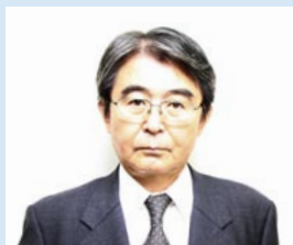
伊万里市副市長 江頭 興宣 氏