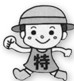
毎月勤労統計調査特別調査キャラクター『とくちゃん』