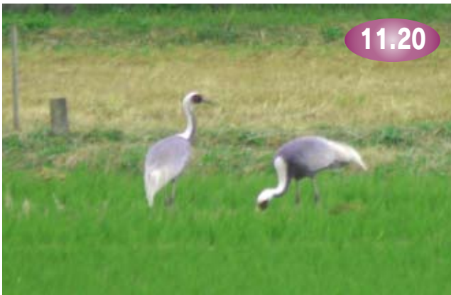
↑エサを仲良くついばむ2羽のマナヅル。ゆっくり滞在してね♪

ツルの『越冬地』東山代町長浜干拓にマナヅル2羽が飛来しました。去年、伊万里に飛来したツルは360羽で、うち6羽が越冬。より多くのツルを招くため市や伊万里鶴の会、日本野鳥の会では、ツルが滞在しやすいように採食環境やねぐら環境づくりに取り組んでいます。この日飛来したマナヅル2羽は、仲良くエサをついばんでいました。