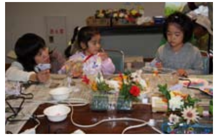
意外と簡単！ホットボンで花差しづくり

『ホットボン』。美味しいわたがしを食べた後は、ホットボンでペットボトルに色とりどりのビーズを取り付けて、花差しや小物入れづくりやチャレンジ。お気に入りの『オリジナル作品』を完成させ、嬉しそうに持ち帰っていました。