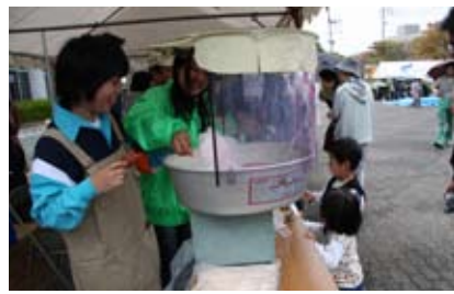
わたがしなどたくさんの屋台が並びました

市内のボランティアが一同に集い、楽しいイベントを繰り広げる『第4回ふれあい広場』ボランティアまつり』が10月26日、市民センターで開催されました。