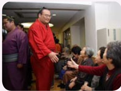
『老人ホームいまり』でお年寄りと握手する高見盛関(中央)