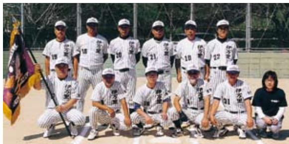
伊万里のオジサンたちはすごい！見事『九州ナンバーワン』に輝いた伊万里倶楽部の選手たち

第20回九州実年ソフトボール大会が10月11日、12日に長崎県諫早市で行われ、伊万里倶楽部が初優勝を飾りました。この大会は、九州・沖縄の県予選を勝ち抜いた50歳以上の選手による各県2チームずつ計16チームが出場。準決勝戦で優勝候補の『長崎実年』を破って波に乗った伊万里倶楽部は、決勝戦でも熊本県代表の『SC熊本』に6対2で快勝し、悲願の『九州ナンバーワン』に輝きました。