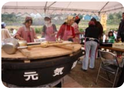
11月3日に開かれた恒例の『夢の市』には市内外から大勢の人が訪れました

川内野集落は『黒米』を生かした加工品開発や、毎年春と秋に開く『夢の市』、都市部の子どもを『農家民泊』させる都市との交流活動への取り組みなどが高く評価され、喜びの受賞となりました。