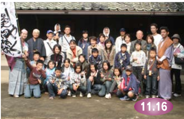
↑前田家住宅で『お殿様』（左）と記念撮影をする参加者たち

伊万里焼の積出港として栄えた伊万里の町を探検して、わが町の歴史を学ぶ『伊万里わーやく歴史探検隊』が開催されました。この日参加した親子連れなど60人は、前田家住宅、伊万里神社、丸駒などを歴史探検。各ポイントでは殿様や町娘などが登場し、当時の生活や歴史の寸劇も。楽しく伊万里の歴史を学び、伊万里を再発見していました。