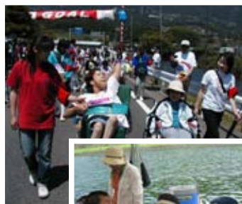
車いすセラミックロードレース大会の様子↓