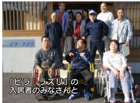
『ピラ・ラズリ』の入居者のみなさんと