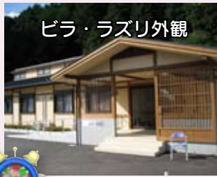
ビラ・ラズリ外観