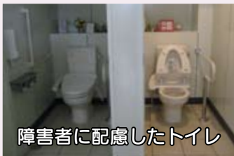
障害者に配慮したトイレ

が濡れると少しすべるので注意しています。店員にも障害のある人の気持ちになって接するよう指導しており、買い物しなくても、遊びに来てほしいと思っています。地域の一人ひとりが障害者の人たちにさりげない見守りや気づかいをできたらいいですね。