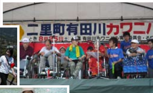
↑有田川カワニバルで歌を披露♪