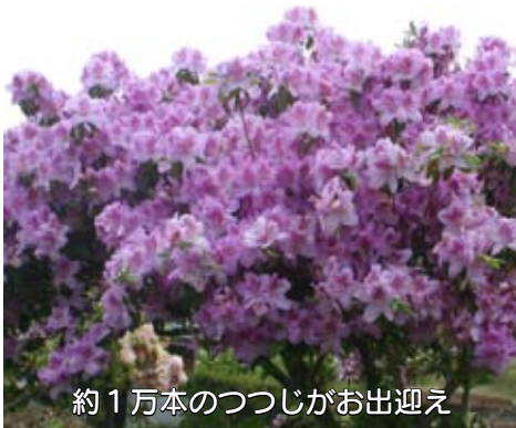
約1万本のつつじがお出迎え