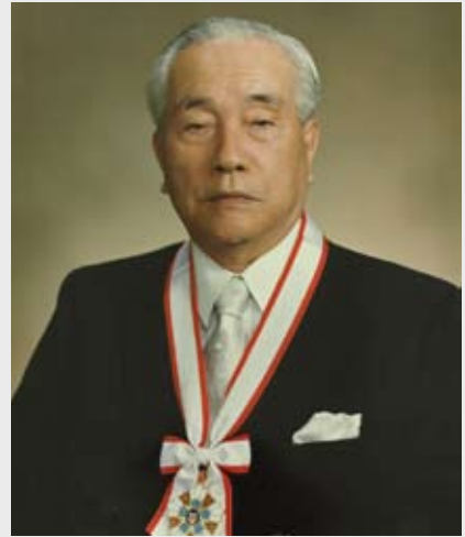
伊万里市名誉市民（元伊万里市長） 竹内 通教 様（享年 88 才）

伊万里市名誉市民の竹内通教様が平成 20 年 3 月 26 日にお亡くなりになりました。謹んでご冥福をお祈り申し上げます。