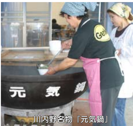
川内野名物『元気鍋』