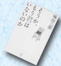
『そうか、もう君はいないのか』 城山三郎 / 著 新潮社