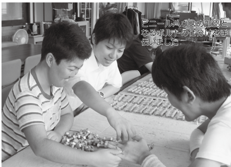
ビニールハウスの部品となるボルトの仕分けを手伝いました