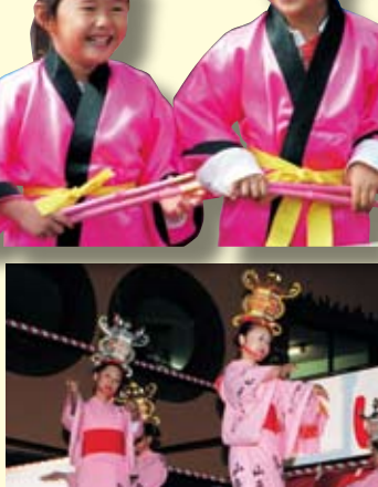
↑艶やかな小鹿灯籠踊りを披露