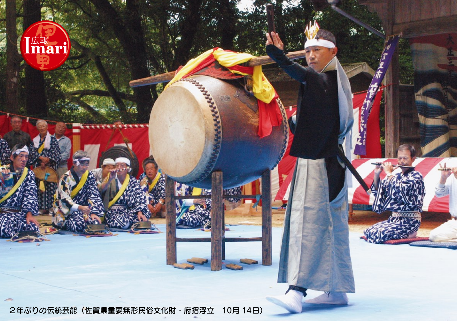
2年ぶりの伝統芸能（佐賀県重要無形民俗文化財・府招浮立 10月14日）