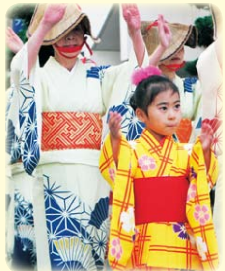
↑大人から子どもまで伊万里の秋を演出