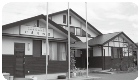
市の委託を受けて市民図書館の清掃業務にも取り組んでいる『いまりの里』