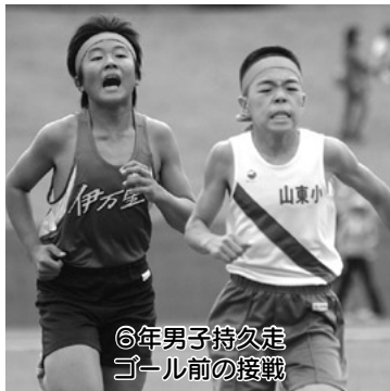
6年男子持久走 ゴール前の接戦