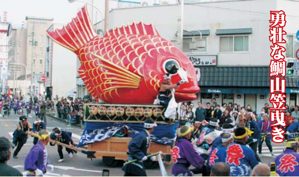
↑波多津曳山保存会による『波多津鯛山笠曳き』が威勢のよい掛け声とともに市街地を勇壮に巡行