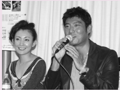
クラクインパーティーで参加したファンと談笑するゲストの高嶋政宏さん(右)と田中美里さん