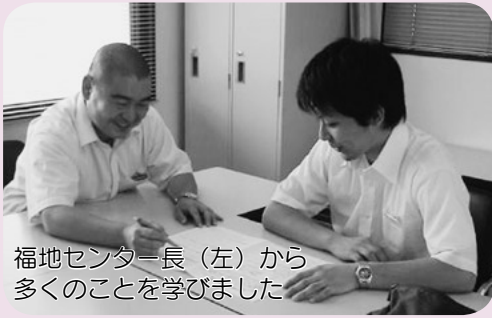
福地センター長（左）から多くのことを学びました