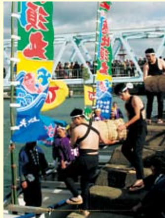
↑和船による焼き物積み出し再現