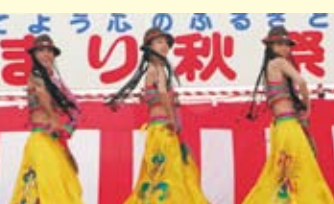
↑中国青島歌舞団の華麗な舞