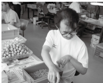
次々に加工作業が進む様子は『町工場』のようでした

国見の里では、身体だけでなく知的、精神の障害者も利用されており、少人数で釣りの具の組立てやリサイクル紙選別の作業をされていました。プラスチックの材料を、それぞれの工程に応じた専用の機械や道具を使って、慣れた手つきで次々に加工作業をされていて、雰囲気はまさに『町工場』と言う感じでした。