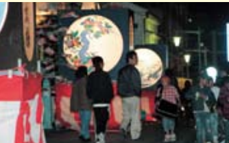
↑巨大ぼんぼりが川面を照らす