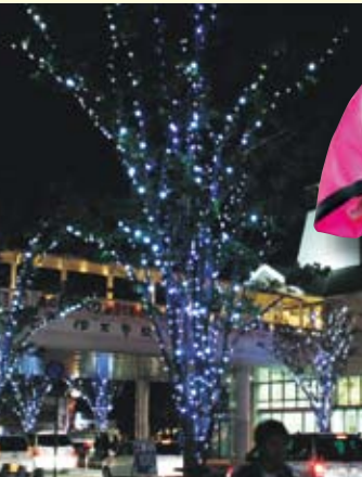
↑イルミネーションが輝く大通り