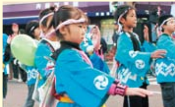
↓1,000人が参加した市民総踊り