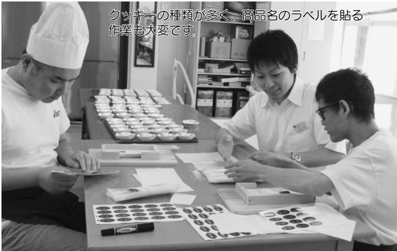
クッキーの種類が多く、商品名のラベルを貼る作業も大変です

また、お菓子の製造販売以外にも、特定信書便の集配業務という独自の事業をされていて、すごく活気があるのが印象的でした。