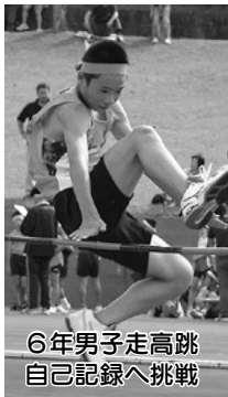
6年男子走高跳 自己記録へ挑戦