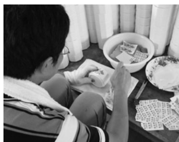
集中して陶磁器の転写作業に取り組む利用者

20代〜50代の15人前後が作業しており、焼き物が山積みされている状態で、ボランティアも多数来られて、皆さん集中して一生懸命に作業に取り組みました。