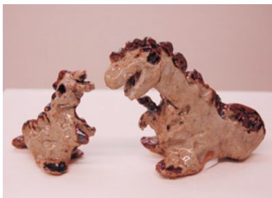
国際アマチュア陶芸展伊万里 2007