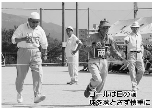
ゴールは目の前 球を落とさず慎重に