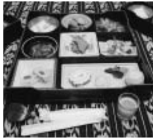
前回のふるさと薬膳料理 『花の内膳』