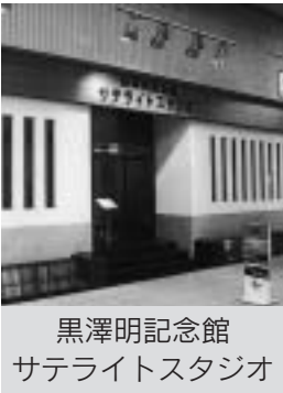
黒澤明記念館 サテライトスタジオ