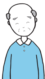
年間一人当たりの老人医療費

グラフは伊万里市の一人当たりの老人医療費を佐賀県平均値と比較したものです。グラフを見ると、伊万里市の医療費は県平均よりも少ないものの、年々増えつつあることがわかります。皆さんが今後も安心して医療を受けることができるよう、医療費を大切に使いましょう。