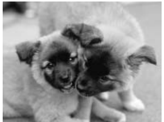
犬の所有者は、その犬について毎年1回狂犬病予防注射を受けさせなければなりません(狂犬病予防法第5条)