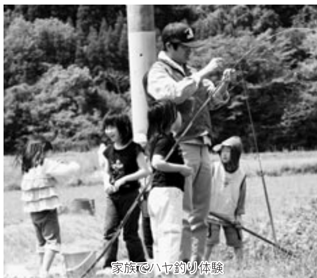
家族でハヤ釣り体験