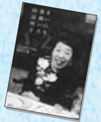
『まいにち薔薇いろ』 田辺聖子 A to Z 田辺聖子/他著 集英社

現代作家を代表する田辺聖子。数々の作品と楽しい暮らしぶりをAからZまでのキーワードで紹介したガイドブックです。 世代を超え多くの読者に支持されてきた田辺文学。人生の応援歌、生き生きと描かれる恋愛小説、そして生きるこの魅力がいつばいびです。