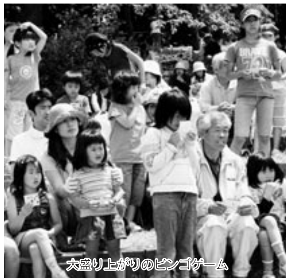
大盛り上がりでのビンゴゲーム