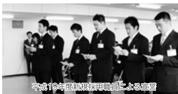
平成19年度新規採用職員による宣誓

総務部秘書課長、総務部情報広報課広報係長、政策経営部企画政策課企画係長などに若手職員を登用しました。