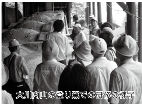
大川内山の登り窯での研修の様子

中退共制度は、中小企業で働く従業員のための外部積立型の国の退職金制度です。掛金助成や税法上の優遇など有利な特典がいっぱいです。安全・確実な中退共制度をぜひご利用ください。