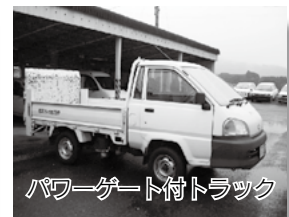
パワーゲート付トラック