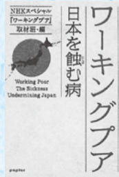
「ワーキングプア 日本を蝕む病」 NHKスペシャル「ワーキングプア」取材班・編/ボラ社

マンガ喫茶を住まいとする若者、睡眠時間4時間で働き続けるシングルマザー、貧しさを受け継ぐ子どもたち…。TV放送だけでは伝えられなかった現場の記録を取材班が本にしました。 夢さえ持てず、人間の尊厳までも奪われてしまう社会に対し取材班は警告しています。