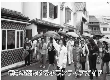
街中を案内するボランティアガイド

商工観光課 (☎232110) Eメールアドレス shoukukankou@city.imari.lg.jp