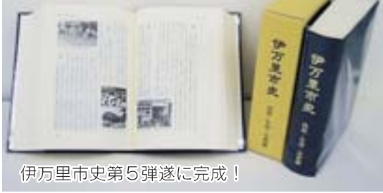
伊万里市史第5弾遂に完成!

伊万里市史『民俗・生活・宗教編』が出来上がりました。市域が広い分、各町にはいろいろな祭りが、また様々な風習や伝説などもあります。そしてたくさん神社や寺院などがあります。旧伊万里市史では十分表すことが出来なかった『民俗・生活・宗教』を今回、独立の編として集大成しました。本編では、聞き取り調査をはじめいろいろな資料を掘り起こし、時代ごとの生活の様子、地域に伝