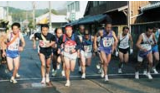
8時45分塚部市長の号砲で山代町浦之崎駅前をスタートする選手たち