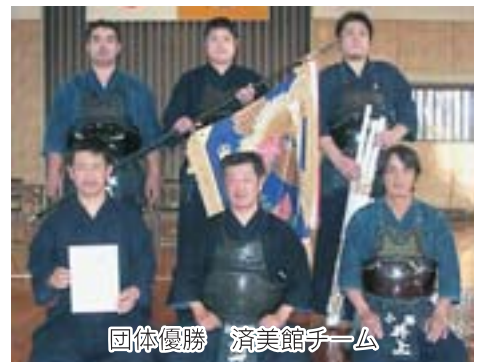
団体優勝 済美館チーム