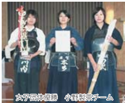
女子団体優勝 小野製茶チーム