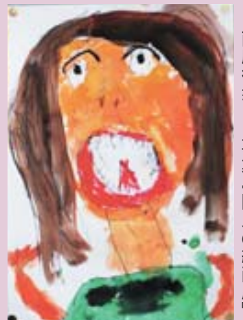
商店街歩こう事業 『園児の絵画展』