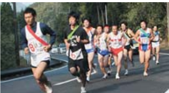
波多津公民館前を再スタートし、起伏の激しい峠コースを力走する選手たち