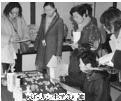
試作した土産の評価