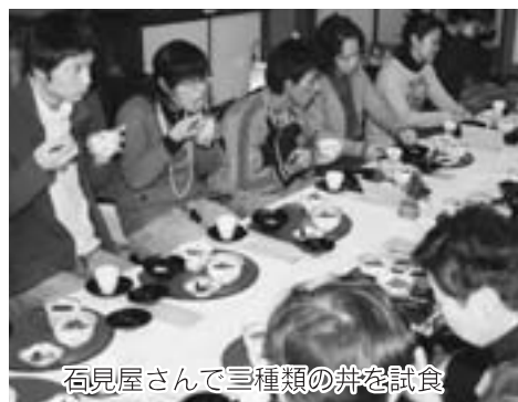
石見屋さんで三種類の丼を試食

モニターの皆さんは、①②③のメニューを消化しながらあらかじめ用意されたアンケート用紙に、実際に歩いてみたまちの印象や料理の味、見た目の感想などを書き込んで