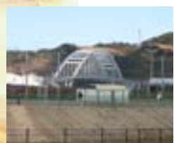
■伊万里湾大橋球技場