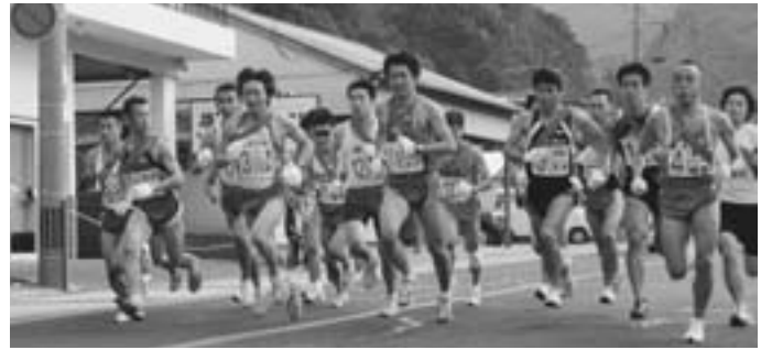
有田町役場を一斉にスタートする20チームの1区の選手