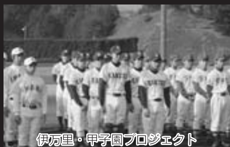
伊万里・甲子園プロジェクト