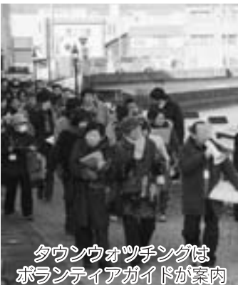
タウンウォッチングはボランティアガイドが案内

市は、まちの顔である『歴史と文化の拠点・伊万里津(旧伊万里町)』を核に、将来的に中心市街地の交流人口を拡大させる施策、仕掛けについて考えています。そこで、2月4日に佐賀市と福岡市からのモニターによるツアーの実験・評価を行いました。