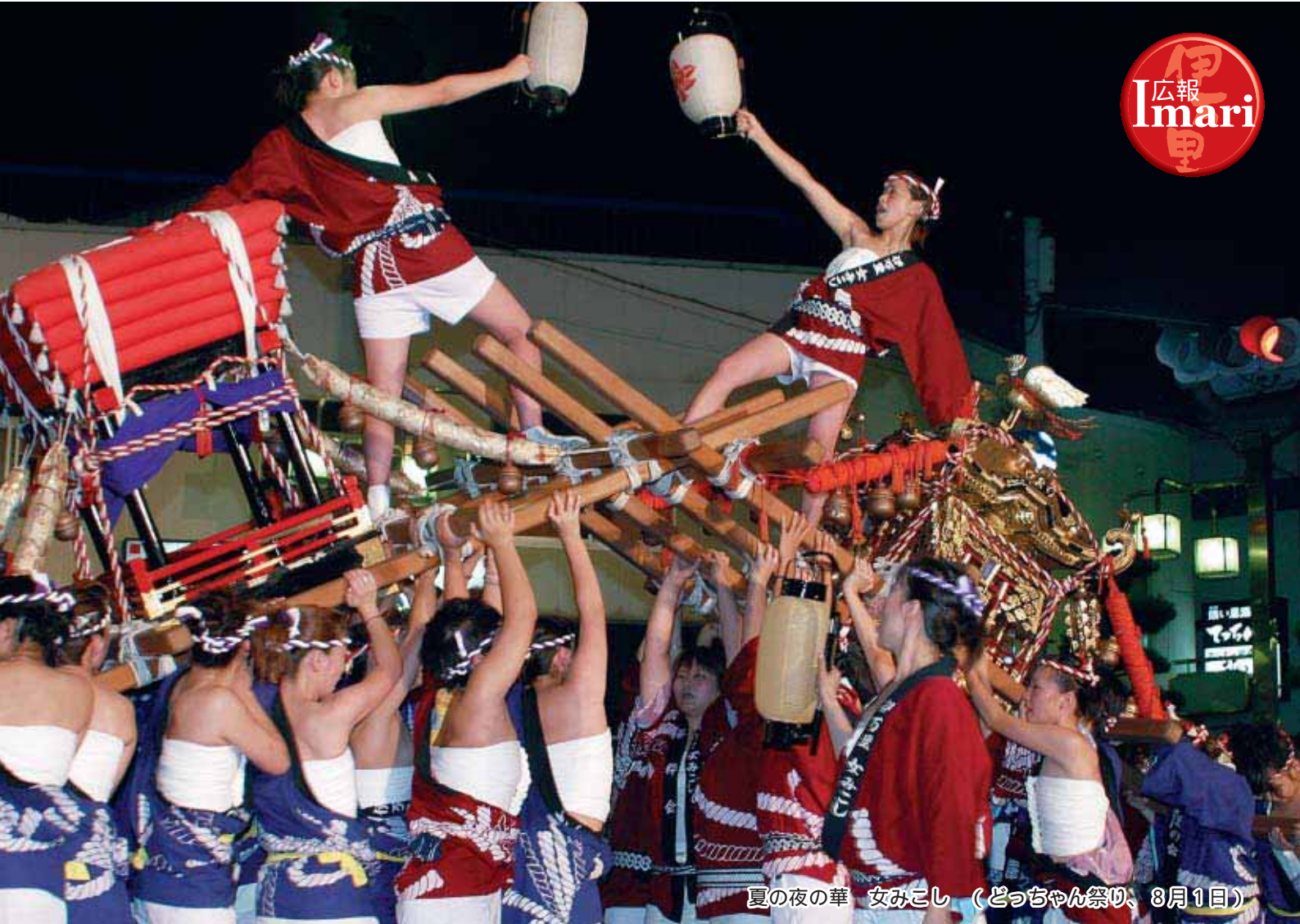
夏の夜の華 女みこし (どっちゃん祭り、8月1日)