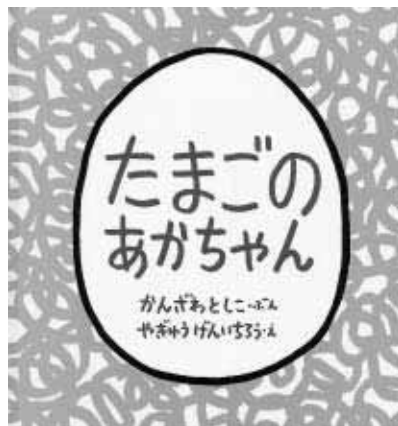
『たまごのあかちゃん』 文・かんざわとしこ 絵・やぎゆうげんいちろう 福音館書店

パカッと割れた卵の中から、動物の赤ちゃんが生まれてくるのを見て、赤ちゃんは大喜び。覚えやすいお話で、割れる前に何が生まれてくるかを当てるのも楽しいようです。「何が生まれてくるかな？」と語りかけやすく、たくさんコミュニケーションがとれそうです。今回のブックスタートでは一番人気の本でした。