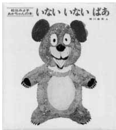
『いないいないばあ』 文・松谷みよ子 絵・瀬川康男 童心社

きつとお父さんやお母さんも、おじいちゃん、おばあちゃんに子どものころ読んでもらったことがあるはず。1967年に発行された、昔から親しまれている定番の絵本です。赤ちゃんは「いないいないばあ」をしてもらうのが大好きです。いろいろな動物が「ばあ!」とおもしろい顔を見せてくれます。「おうちにも持つてるよ」という声が一番多かった本です。