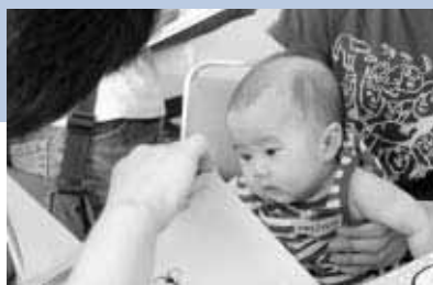
『赤ちゃんといっしょ』 (NPOブックスタート発行)より

ブックスタートは、肌のぬくもりを感じながらことばと心を通わず、そのかけがえのないひとときを『絵本』を介して持つことを応援する運動です。