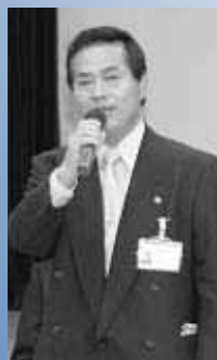
伊万里市長 塚部芳和