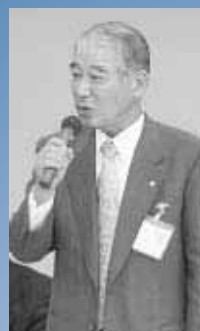
有田町長 篠原啓一郎