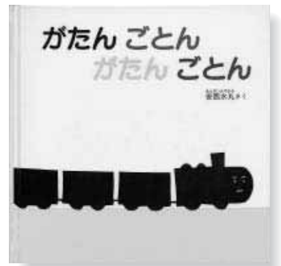
『がたんごとん がたんごとん』 作・安西水丸 福音館書店

ブックスタートパックには、図書館利用登録申込書が入っています。参加した赤ちゃんたちがこの申込書で利用カードを作り、おうちで絵本を読んでもらい、成長とともに自分で借りて読むようになる。そして、結婚して赤ちゃんが生まれたら、その子にもまた絵本を読んでもあげる。ブックスタートがまさに始まりとして、こうした世界が続いていったら…。とてもステキなことだと思いませんか。