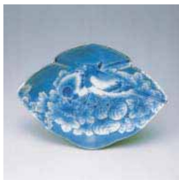
そめつけせきれいもんざら 染付鶴鴿文皿

鍋島 1660~1680年代 高さ 3.5 口径12.4~17.5 底径 6.2~9.2cm 伊万里市重要文化財