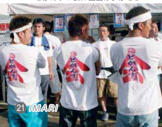
ほら貝が響くと伊万里太鼓のお出ました！