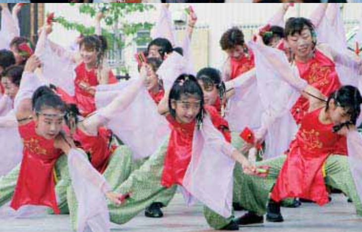
きらびやかな衣装に身を包んだよさこいチーム