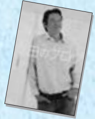
「古田のブログ」 古田敦也/著 アスキー

日本球界を代表する捕手・古田敦也選手。このほど選手兼任監督に就任し、プロ野球への熱いまなざしは、多くのファンの支持を得ています。本書は、本人の公式ブログをまとめたものです。毎日のちよつとしたこと、2000本安打を達成したことなどがつづられています。古田選手の素顔に近づける一冊です。