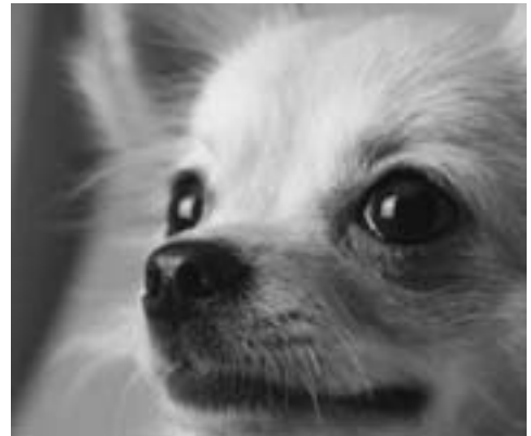
犬の所有者は、その犬について毎年1回狂犬病予防注射を受けさせなければなりません。(狂犬病予防法第5条)