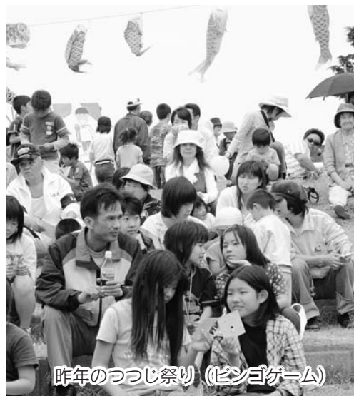
昨年のつつじ祭り(ビンゴゲーム)