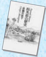
『四角形の歴史』 赤瀬川 原平/著 毎日新聞社

木は曲がり、山はこぼれ、川はくねくね…。自然界のものはみなぐにやぐにやして見つけ出したのだらう。 この本は、著者がカメラのファインダーをのぞきながら考えたのが始まりです。窓から眺める四角形の風景。あたりまえと思っていることに不思議の種をまいてくれます。