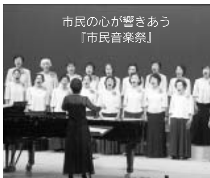
市民の心が響きあう『市民音楽祭』