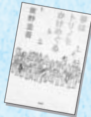
『夢はトリノを駆けめぐる!』