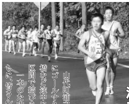
山代町浦之崎駅前をスタートし、市役所玄関前にゴールする市内一周61.8キロのコースを、相生橋など途中に3か所の再スタート地点を設け、12区間で続きます。 一本のたすきをつなぎ、懸命に力走する選手たち、皆さんの温かい声援をお願いします。