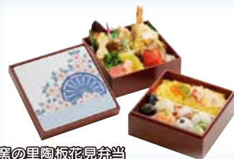
秘窯の里陶板花見弁当