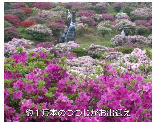
約1万本のつつじがお出迎え