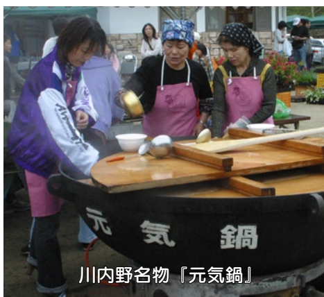
川内野名物『元気鍋』