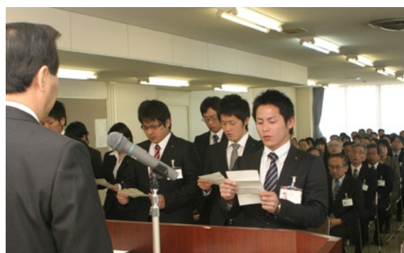
←塚部市長（左）に宣誓を行う平成21年度新規採用職員