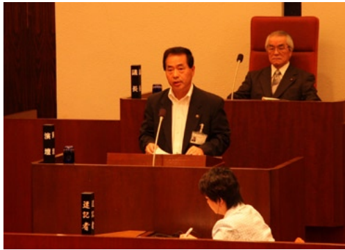
一般議案（第3回臨時議会）

第3回臨時議会では一般議案1件、第4回臨時議会では予算議案1件の審議が行われ、いずれも原案のとおり可決されました。内容は次のとおりです。