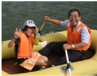
↑おいしい屋台が並ぶ物産展 川と親しむゴムボート大会↑