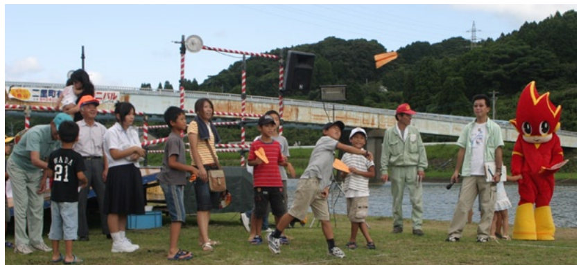
↑ちびっ子に大人気の紙飛行機大会