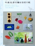
『今森光彦の魅せる切り紙』 山と溪谷社