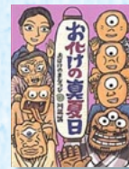
『おたけの真夏日』 B.L出版