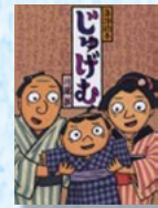
『落語絵本 しゅげむ』 クレヨンハウス