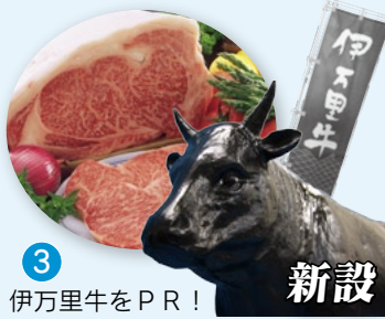
3 伊万里牛をPR！ 新設

2009年もあとわずかで暮れようとしています。あなたにとってこの1年はどんな年でしたか？楽しかったこと、辛かったこと、2009年・平成21年は、あなたの周りでいろいろな出来事があったことでしょうか。