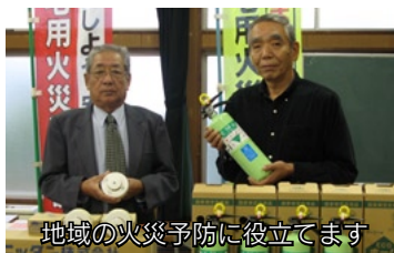
地域の火災予防に役立っています

10月23日、(社)全国消防機器協会より選考された大坪地区に、住宅用火災警報器100個と消火器20本が配布されました。これは、同協会が行う社会貢献活動の一つで、住宅用火災警報器の設置義務化を踏まえ、火災予防の普及に係わる広報・普及啓発活動を目的としています。