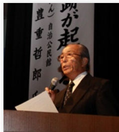
黒川町の事例発表

大賞 波多津町浦 特別賞 二里町福母 特別賞 東山代町川内野 入賞 伊万里地区蓮池町 入賞 牧島地区木須西 入賞 大坪地区栄町 入賞 立花地区南ヶ丘 入賞 大川内町小石原 入賞 大川内町市村 入賞 黒川町牟田 入賞 黒川町畑川内 入賞 波多津町内野 入賞 南波多町府招上 入賞 大川町宿 入賞 松浦町上原 入賞 山代町楠久 入賞 山代町西分