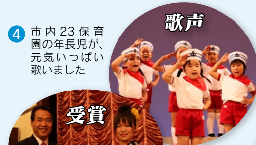
4 市内23保育園の年長児が、元気いっぱい歌いました