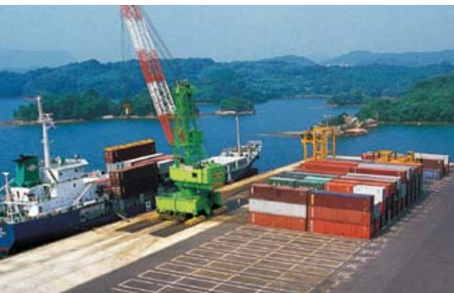
七ツ島コンテナターミナル

相次ぐ工場などの増設に伴い、伊万里団地および七ツ島工業団地の分譲が大きく進んでいる状況にあることから、団地の完売に向け、企業への誘致活動のさらなる強化に努めるとともに、将来における企業誘致の受け皿として、多様化する企業の立地動向に対応した工場適地の調査・研究に取り組んでいきます。 また、誘致企業などは、市外からの通勤者が多いうえ、今後の大規模な雇用拡大も予定されていることから、このことを定住促進の好機ととらえ、新たに設置した企業向けの相談窓口による積極的な転入支援に努めます。