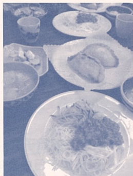
おいしく出来上がった 当日の料理