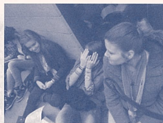
高校の同級生 (教室の外で先生待ち)