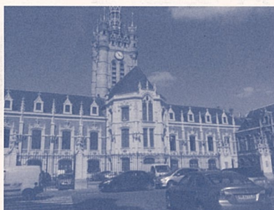
Douai(ドゥエー)の町の時計台