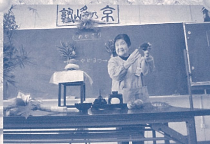
子子孫孫の繁栄を願って・・・

中国、タイ、イギリス、カナダ、ニュージーランドの14名と市民等、計46名が参加、交流を深めました。