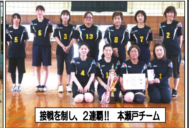
接戦を制し、2連覇!! 本瀬戸チーム

※球技大会で、グローブとタオルの忘れ物をお預かりしています。心当たりのある方は公民館までご連絡ください。 ☎22-5783