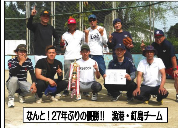
なんと!27年ぶりの優勝!! 漁港・釘島チーム