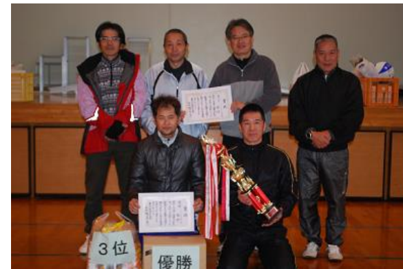
脇野チーム インディアカ優勝、ソフトバレー3位