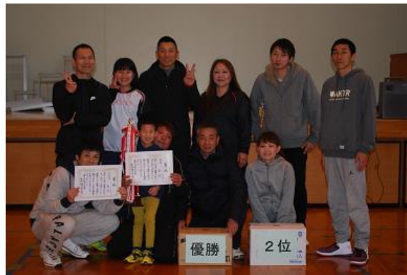
長浜チーム ソフトバレー優勝、インディアカ準優勝 第3位：脇野