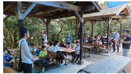
ご協力いただきました子ども会役員の皆様、早朝から夕方までお疲れ様でした。ありがとうございました。

9月15日(日)「西彼青年の家」(長崎県西海市)で、ジュニアリーダー養成研修会を開催し小中学生23名が参加。4グループに分かれ、出された課題を解決するフィールドグループゲームに挑戦。4人で知恵を出し合い課題を解決。昼食は、バーベキューで、野菜を切ったり、火を起こしたり、野外調理を体験。参加者からは「ゲームの問題は少し難しかったけど、仲間で一緒に考え解くことができた。」「みんなでバーベキューができて楽しかった。準備から自分たちでしたのでいつもよりおいしく感じた。」などの感想が聞かれました。