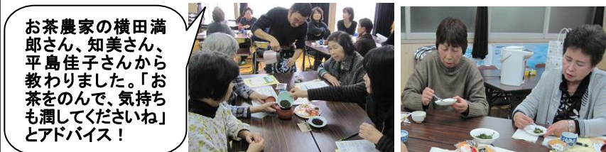
注いだ後の茶葉を食べる初体験。「わぁ～おいし！」と感動!

12月18日(水)昼と夜の2回開催。昼16名、夜18名が参加。こだわりの栽培法やお茶の種類、おいしくのむためのお湯の温度や注ぎ方などを学びながら、緑茶や紅茶を味わいました。