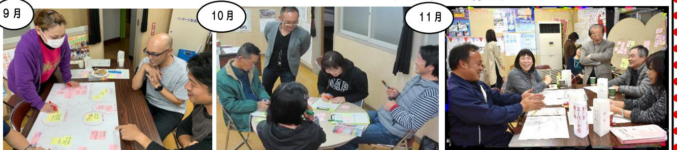
「人のつながり」を生み出す方法は？をテーマにトーク！ざっくばらんな雰囲気の中、おもしろいトークが展開