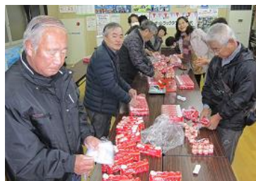
ヤクルトに、手作りのメッセージカードを添えて...

12月19日(木)9時から民生委員が公民館で準備。町内約200人の独り暮らし高齢者の家を訪問。民生委員は定期的に訪問し、気軽に話をしながら生活状況や体調の確認など、一人一人に寄り添った見守りを続けています。