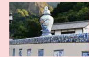
鍋島藩窯橋 陶板と無数の陶片が施された橋。欄干の外側には竜と鳳凰(ほうおう)が描かれています。