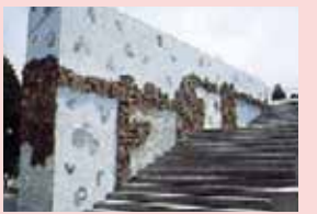
大壁画 陶片とトンバイで登り窯をアレンジした壁画のモニュメントです。