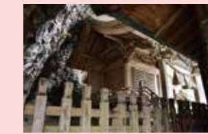
権現岳神社 市内に現存する江戸時代の社殿建築の中でも工夫をこらした優れた建物です。

唐臼小屋 陶石を細かく砕くため水の力を利用した大型の臼が実際に大きな音を立てて動いています