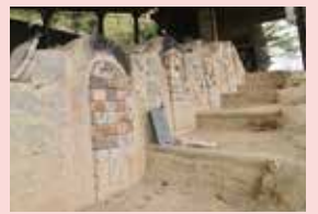
登り窯 昔ながらの薪で炊く登り窯。献上品の焼成などに使用されています。