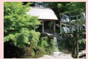
めおとしの塔・唐臼小屋 めおとしの塔から美しい音が響きます。水の力を利用した大きな臼は必見。