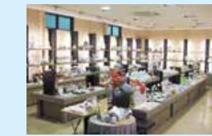
伊万里鍋島焼会館 各窯元の代表的な焼物を展示即売しています。喫茶コーナーも併設。