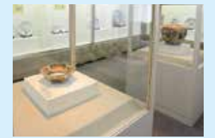
伊万里・有田焼伝統産業会館 焼物の歴史が学べる資料館。絵付け体験もできます。