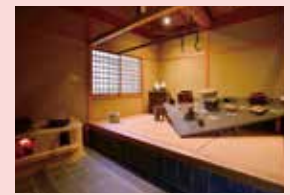
陶工の家 藩窯当時の建物を再現。当時の陶工たちの暮らし振りもうかがえます。