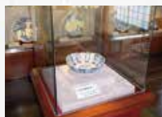
伊万里市陶器商家資料館「展示コーナー」