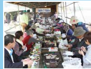
カキ焼き期間：11月3日～4月頃(団体要予約) ※3月以降はカキの在庫に左右されるので要確認

波多津で採れた新鮮なカキをはじめ、伊万里牛＆海鮮バーベキュー、サザエのつば焼きなど、伊万里の豊富な食材を堪能できます。また、塩作りや、ピザ作りを体験することができます。