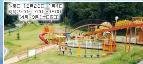
休園日：12月28日～1月4日 時間：9:00～17:00/～18:00 (4月～9月の土日祝日)

海や山などの自然にめぐまれた地域の特性を活かし、大型複合遊具や草スキー場など、無料で大人から小人まで一日中安心して過ごせる公園です。