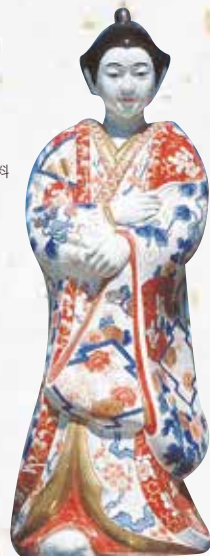
左:伊万里市陶器商家資料館 右:海のシルクロード館

古伊万里の歴史や文化を体験できる施設としてオープン。2階には古伊万里を展示した古伊万里ギャラリー、1階にはクワ、絵付けの体験工房と肥前一带の焼物販売コーナーがあり、お土産の購入に最適です。 営業時間 9:30~17:00 入場料 無料 定休日 毎週月曜日(祝日は翌日振替)、年末年始 ☎0955-23-1189