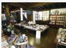
海のシルクロード館1階販売コーナー