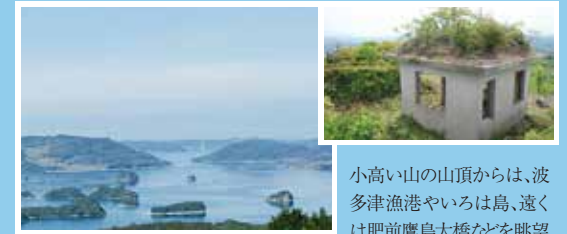
小高い山の山頂からは、波多津漁港やいろは島、遠くは肥前島大橋などを眺望

することができ、大自然のパノラマを満喫できます。また、山の斜面には、戦時中、敵の襲来に備え上空を監視した「監視哨(しょう)」の一部が残っており、終戦後は、監視哨のそばに平和を願う石碑が、地元有志で建立されています。波多津公民館 ☎0955-25-0001