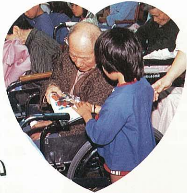
◎おじいちゃん いつまでもお元気でネ

園児たちは、おゆうぎ会のために練習を積んだ「おじいちゃん、おばあちゃん」などの歌3曲と、「宮殿のおどり」などおどり4曲を披露し、自分たちで作った花かごと、折り紙で作った首かざりや「みなさんお元気で」などと書いた手紙を入れたおみやげ袋約70個を配りました。おじいちゃん、おばあちゃんたちは、かわいい園児たちのプレ