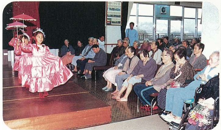
◎わたしたちきれいでしよう！

ゼントに大喜び。「子どもたちの訪問が一番嬉しいようです。笑顔が違いますよ」と前山事務長も話していました。