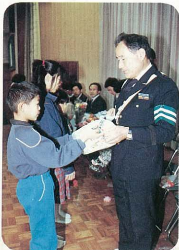
◎手づくりのプレゼントを

誕生会を訪れ、歌やおどりを披露しています。そして障害もったり、寝たきりのお年寄りとのふれあいを深めるなかで、いたりや思いやりのこころを学んでいます。