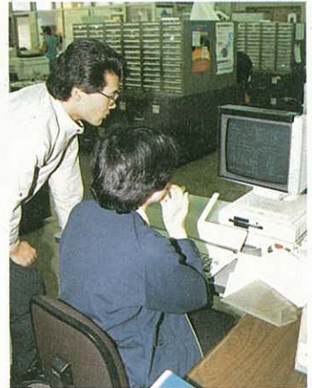
◎端末機で諸証明作成

市税条例の改正の主な内容は、地方税法の一部改正に伴い、市民税について所得割の税率の累進構成の緩和、配偶者特別控除制度を新たに設けました。