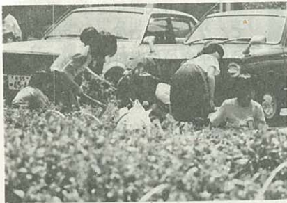
● 低学年は学校のまわりの清掃です