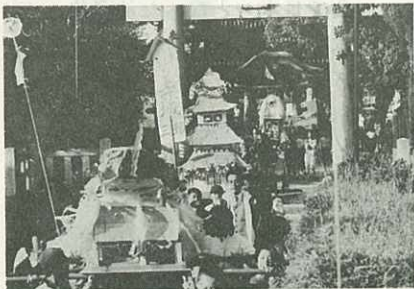
● 青幡さんへくり出したみこし

の菊まで6種類、一人一はちを植え、学校中が花いっぱいになりました。土づくりのプリントを配ったり、花を育て花を愛するやさしい心を育てました。