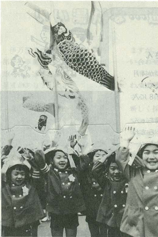
▲元気に泳げ こいのぼり(4/26) 児童週を迎え市役所前広場に市内の 保育園児200名を集め、こいのぼりをあ げました。