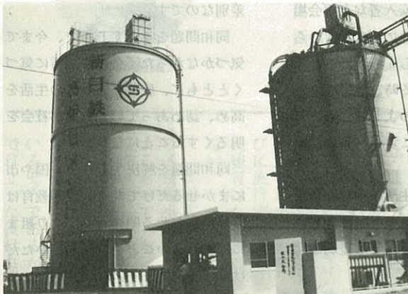
▲セメントサービス・ステーションが相次ぎ完成(4/27) 新日鉄化学のセメント供給施設が久原の伊万里工業団地に 完成。小野田セメントもまもなく完成します。