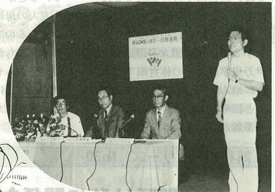
▲アイラブ伊万里1日放送局を放送(5/1) 青年会議所は、伊万里有線テレビで1日放送局 を実施。東京の5ツ子ちゃんも出演しました。