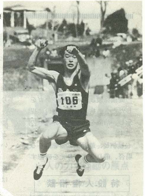
▲明日へ向って飛べ…るかなあ？

4月29日から5月8日までは第6回市長旗争奪高校野球大会、5月3日、8日は第5回市長旗争奪中学生野球大会、5日は第19回国見台陸上競技選手権大会が開かれました。中学野球は、国見中が、高校野球は伊万里高校がそれぞれ優勝しました。また、8日には早朝ソフトの開会式に113チーム2,300人が参加、15日は、早起き野球に65チーム約1,000人が参加して、これから夏場へ熱戦をくりひろげます。スポーツを通じて健全な心と体のまちづくりを進めましょう。