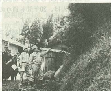
▲波多津町浦の急傾斜危険地域