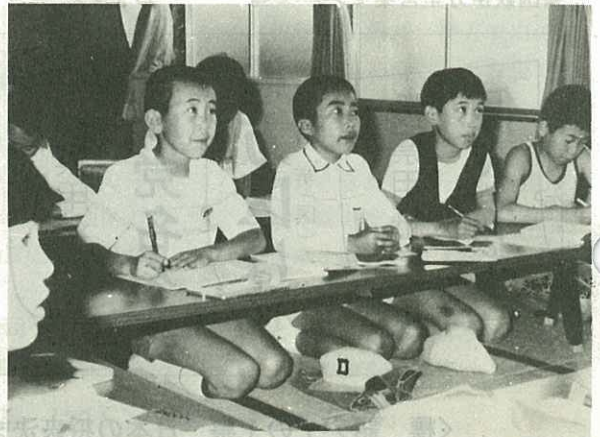
▲大きな声でニイハオ！さあもう一度

こんにちは……你 好(ニイハオ) さようなら……再 見(ザイジェン) ありがとう……謝 謝(シェシェ) いらっしゃい……你来了(ニイライラ)