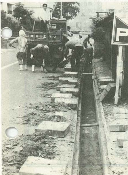
▲みんなの力ですっかりきれいになった側溝

6月5日から環境週間が始まりますが、市民一人一人の力がこの運動の原点ではないでしょうか。