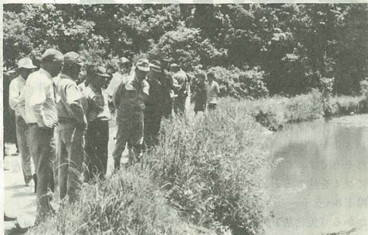
▲老朽ため池で地元の人たちから説明を聞く（松浦町宿分）