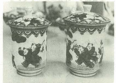
▲唐子絵がらの湯のみ茶わん

原音は「チョッパグ」。夕顔（干瓢をつくる）を2つ割りして果肉を除き、かわかしたもので釉（陶磁器の上薬）をまぜる作