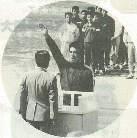
▲国見台陸上選手権の開会式