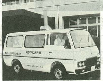
▲雨の中を第1号が出発しました。

入浴車は、伊万里市が7台め。寝たきりのお年寄りに文字どおりラッキー7となることでしょう。