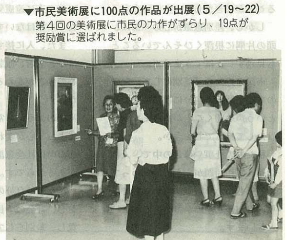
▼市民美術展に100点の作品が出展(5/19~22) 第4回の美術展に市民の力作がずらり、19点が 奨励賞に選ばれました。