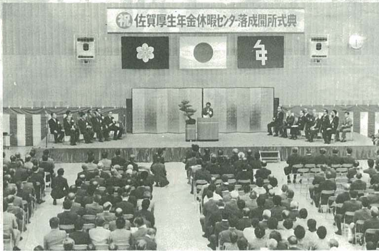
四百人が参加した落成式

口を目標に建てられており九州では初めての施設なので、この付近の名所になるに違いない。 これで伊万里市は従来の通過型観光地を脱皮して、宿泊型観光地へとクローズアップし、また前面の国見台運動公園を併せると九州でも有数の運動施設を有することとなるので、これから各種の九州大会など大型の大会が開かれることになる。早速来年の春は九州ゲートボール大会を開くように準備を進めている。 幸い今年には休暇センター南の腰岳中復を走る過疎林道が完成し、昨年市民の皆さんで千本の桜を植えて、伊万里富士千本桜と命名したが、その終点の大川内山では閑所のある藩窯公園ができあがるので観光ルートとしても楽しみみである。 宮崎の生駒高原がコスモスだけで土曜、日曜に十万の人が訪れているので、春と秋に伊万里富士のルートが一大名所となるよう、さらに工夫をこらしている。 市民の皆さん、まづは休暇センターを訪れて、ひとときのレジャーを満喫してください。 (竹内)