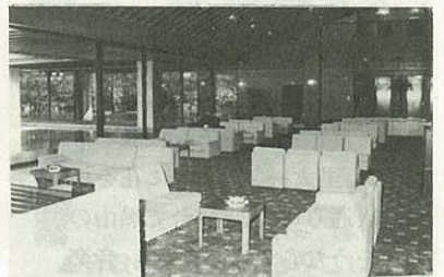
▲室内は一流ホテルなみ

待望久しかった厚生年金休暇センターが去る十月二十二日、いまりトンテントン秋祭にあわせてオープンされた。 現在地に決定して完成までは四年であるが、その前に六年間、よそにわからぬよう潜行運動をはじめ、さらに用地選定の条件が変るなどして歳月を要したので十年になんなんとし、待望久しかったわけである。 しかしその完成されたものを目の前に見たとき、これまでの苦勞も一度に吹き飛ばしてしまうほどの立派な施設に驚いた。 庭の池に水をたゝえた風情をロビーで眺める姿は、一流の観光地の一流の施設も及ばない雰囲気である。 来年のプールのオープンには水着ショウをしてミス水着を選びたいと思うがいまからプールの混雑が思いやられる感じがする。 もともとと周辺五十万人の