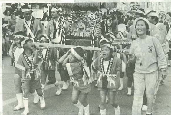
▲子どもたちの創作みこしパレード