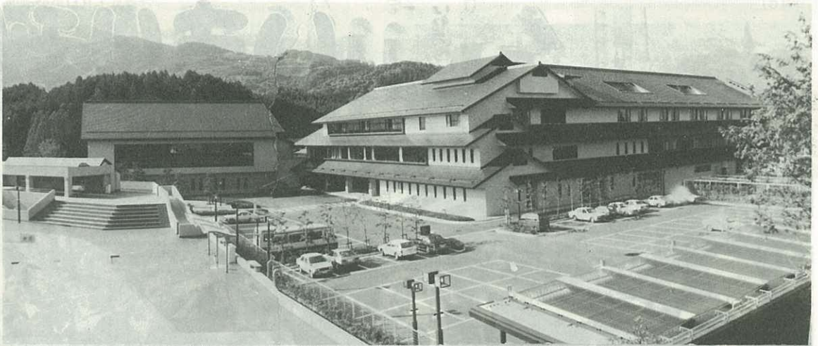
▲腰岳山ろくの緑に囲まれた休暇センターの本館(左手は体育館)