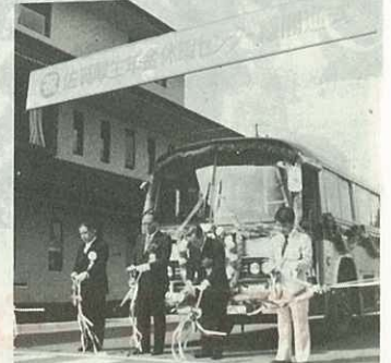
▲1日6往復のバス路線も開通