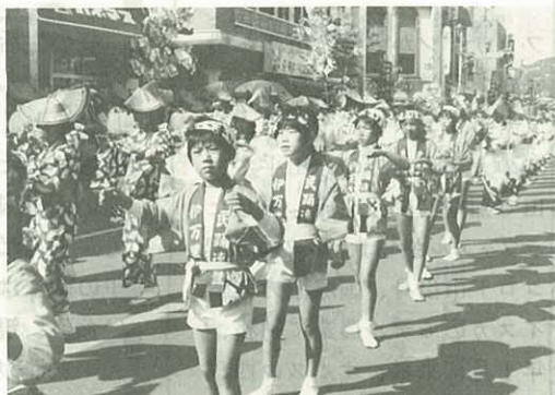
▲大人も子どもも総踊り