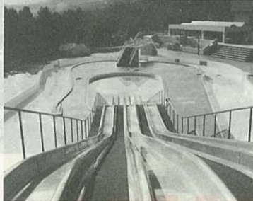
▲スライダー付流水プール

テニスコートは、全天候型6面、うち3面は夜間照明付。多目的運動広場は、ゲートボール7面、うち1面は夜間照明付き。このほか、子どもたちに人気のフィールドアスレチックや一周2.4キロの散策路などがあります。