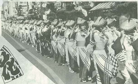
◀千三百人が参加した総踊り