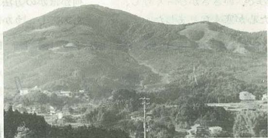
▲黒曜石の産地でもあった腰岳

その歴史も今は昔、騒動の地腰岳は、トラピスト修道女たちの敬けんな祈りの地となっています。