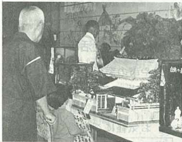
▲市民会館に展示された野口さんの作品

▲申込先 一般家庭は各区長、駐在員さんへ。事業所は市役所企画課企画統計係(☎③-2111 内線405)か各出張所へ