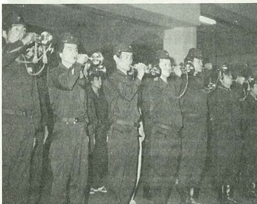
▲消防ラッパ隊を結成

敬老の日の15日、各地でお年寄りの健康と長寿を 願って敬老会が行われました。(%)