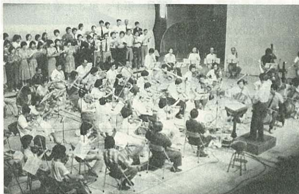
▲「交響詩伊万里」の録音風景(9/5)

また、当日は会場で「交響詩伊万里」のレコードを販売します。2,000枚の限定LP盤で、価格は1,500円の予定です。