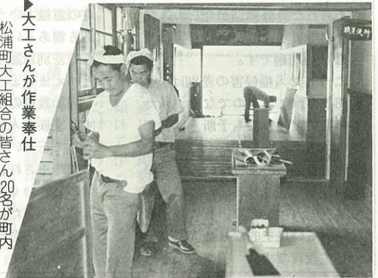
大工さんが作業奉仕 松浦町大工組合の皆さん20名が町内の 学校や公共の建物の破損した箇所を 補修。(%)