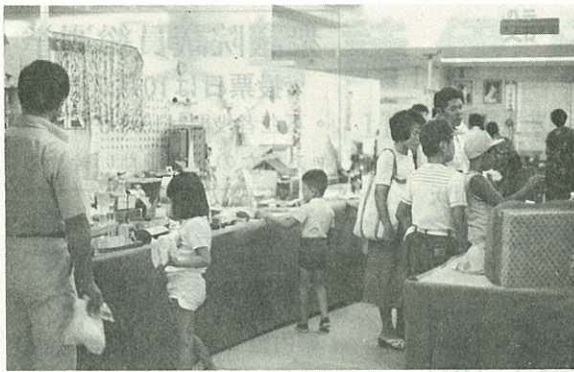
▲市内小中学校夏季作品展

夏休み中に作った児童、生徒の力作アイデア作品 約2,000点が、玉屋特設会場に展示されました。(%)