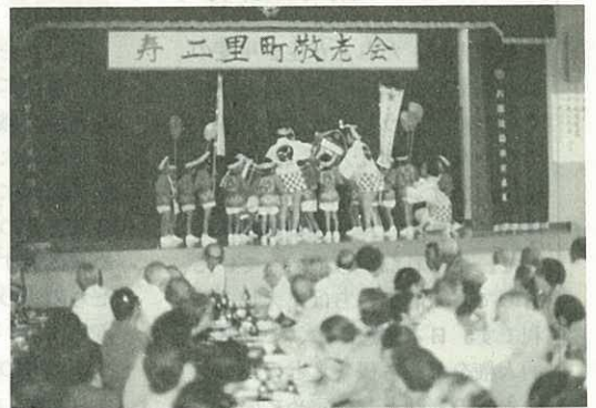
▲市内各地で敬老会

敬老の日の15日、各地でお年寄りの健康と長寿を 願って敬老会が行われました。(%)