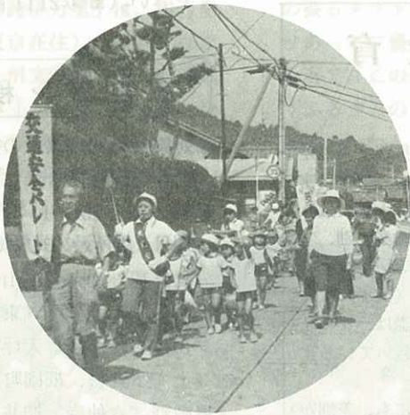
浦之崎保育園では交通安全パレード 50名の園児が、バトンや太鼓を手に交通安全を 呼びかけパレードをしました。(%)

梨どころ大川町の保育園児40名が、梨狩りを楽しみました。梨園は甘い香りがいっぱい。(%)