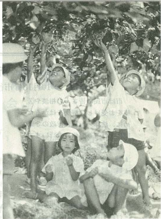
▲保育園児が梨狩り

梨どころ大川町の保育園児40名が、梨狩りを楽しみました。梨園は甘い香りがいっぱい。(%)