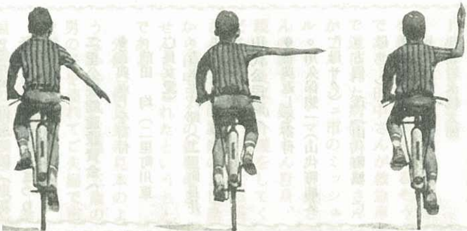
させつ あいず 左折の合図