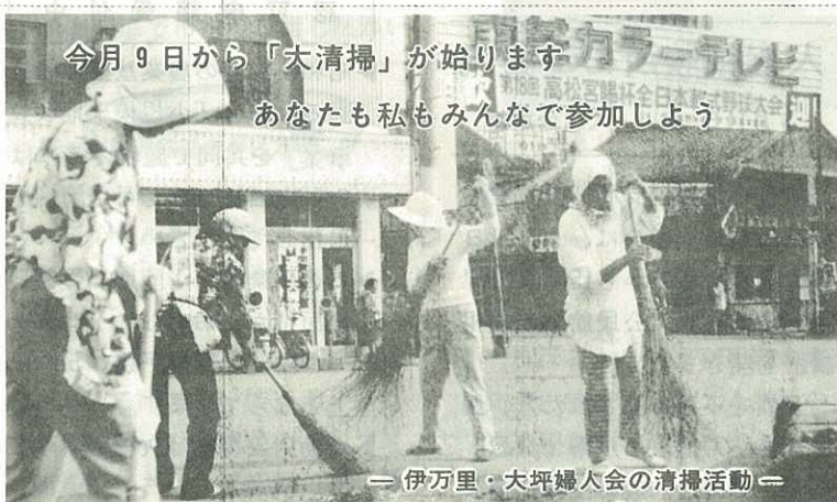
今月9日から「大清掃」が始ります あなたも私もみんな参加しよう

◆もとめます ミシン3・乳母車1・子供用自転車7・自転車10・ピアノ2・オルガン6・剣道防具・平板測量機組立式ブランコ・ベビーベット2・2段式ベット2・陳列ケース4・洋服ダンス1・アルミサッシ・子供用いす・書棚・ガス風呂4・カラーテレビ・ファンクーラー・テープレコーダー・電気こたつ・洗たく機4・電気釜・小型冷蔵庫・プロパン用湯わかし器・扇風機5