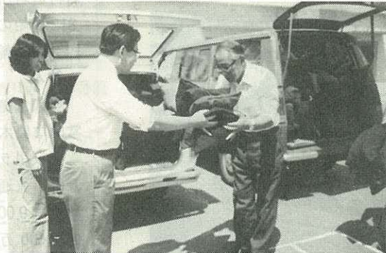
▶ざぶとんを手渡す樋渡工場長◀