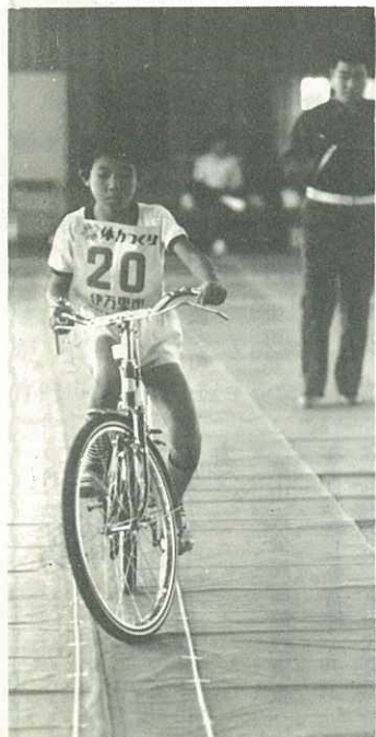
▶ せまいコースにいとむお友だち ▶

大会は、市内5小学校7チーム28人が出場して行われ、自転車乗車の熟練度をテストするジグザグ運転や左右転回操縦、それにロータリー通行など、むずかしいコースで実技を競いました。出場選手のすばらしい操作に、交通指導員のおじさん達も見とれていました。