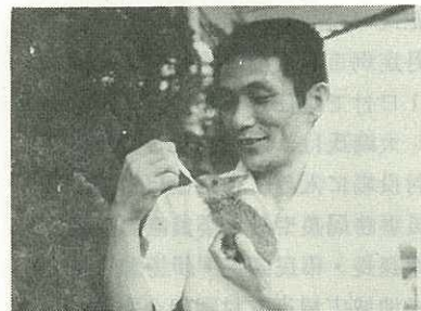
▶スポイドでミルクをもらうピョン吉◀

まではミルクをスポイドで飲んだり、クローバーやレタスなど自分で食べるほどに成長しました。大事に育てます。」と話していました。