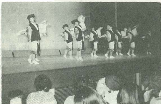
▶観客を魅了し大成功だった民踊大会◀

域グループなどの力いっぱいこの踊りに客席をうめた市民から大きな拍手がおくられていました