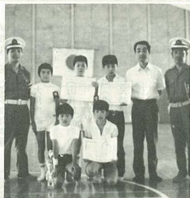
▶ 優勝した二里小チーム ▶

二里小チームは、7月18日に佐賀市で開かれた佐賀県大会に出場しましたが、参加14校中7位となりおしくも入賞できませんでした。市の大会での成績は右の通りです。