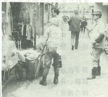
環境今月のテーマ 「害虫」とその駆除