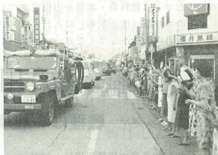
▶ハンカチをふって別れをおしむ皆さん◀