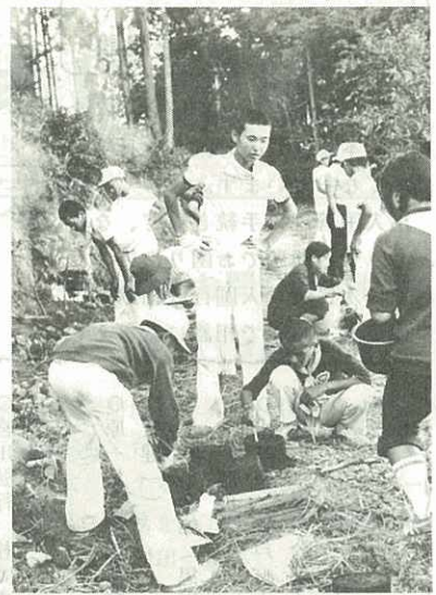
▶楽しい炊飯のひととき◀

このように、校区内の自然を活用して行われた2泊3日のキャンプは、市内でも珍しいケースです。そのかげには、若人に何か一つでも印象に残るものをと、キャンプ場の給水や除草作業・道路の整地などに奉仕した提川地区の皆さんや指導・助言された先生・婦人会青少年育成会・公民館などの献身