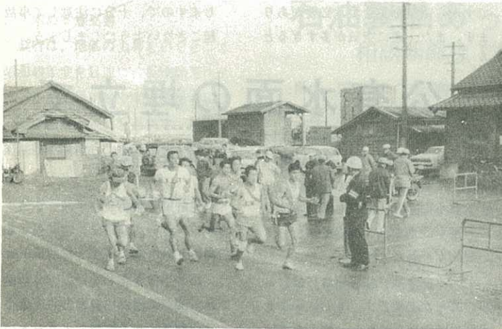
▶ 久原駅前をスタートする各町の選手たち ◀

町中山神社前～波多津郵便局前～黒川公民館を経て、ゴールの市民会館まで、9区間・56.7キロメートルで