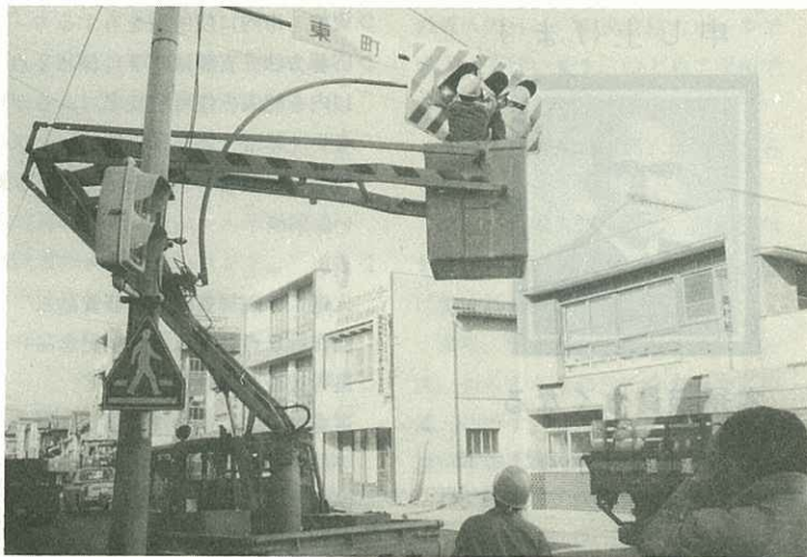
▶東町三差路の信号灯を清掃する九電の係員◀