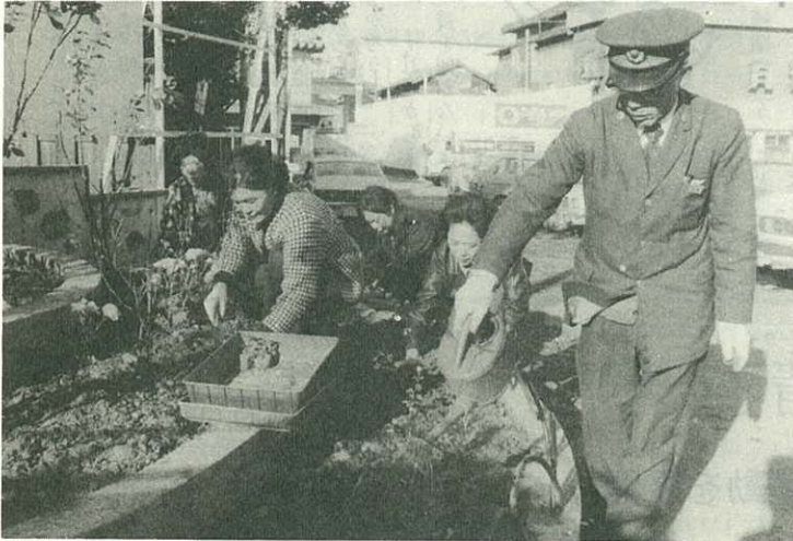
▶花だんに花の苗を植える伊万里町婦人会◀