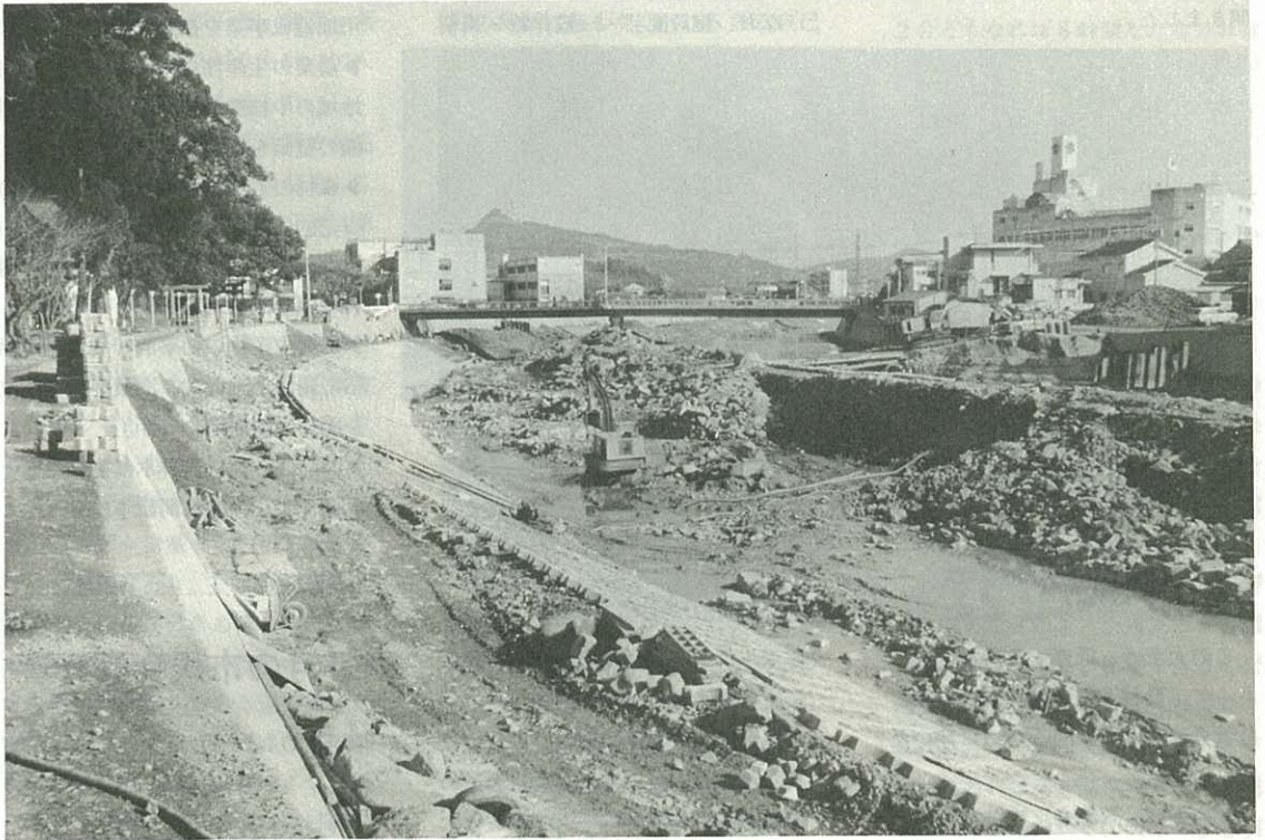
—最後の仕上げを急ぐ伊万里川— (2月20日撮影)