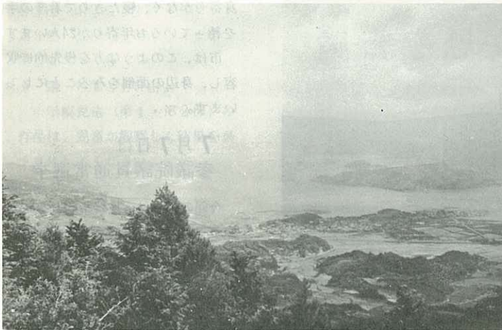
▶ 竹の古場から躍動する伊万里湾を望む ◀

伊万里港は、昭和42年6月開港指定以来、合板企業などの目ざましい躍進によって着実な歩み続け、今年4月16日には待望の1,000隻目の貿易船が入港するなど、今や国際貿易港としての位置を築きました。