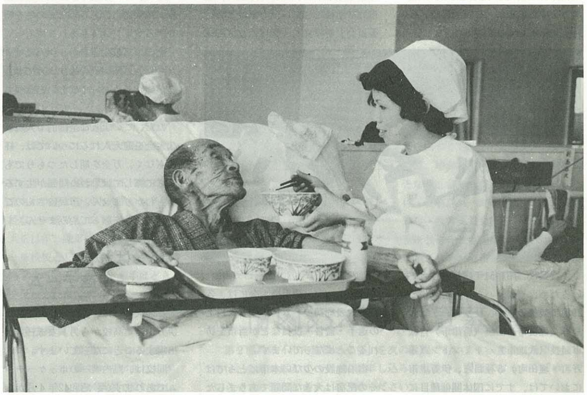
—寮母さんの助けて食事するお年寄り—

昭和29年8月19日 第3種郵便物認可 毎月1日発行 定価1部5円 昭和49年7月1日 伊万里市役所総務部企画課発行 No. 245