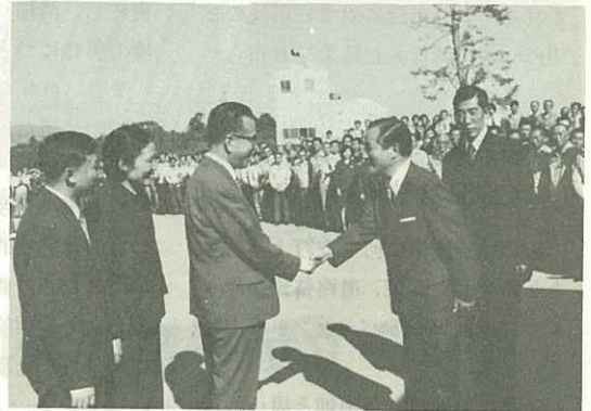
▶市役所玄関前で市長と握手する陳大使◀