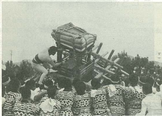
▶激しくぶつかり合うトントン◀

としては大事な時期。祭りを開く時期について、農家の意見も反映してほしい。今年は、市外の親せきにも電話で遊びに来るのを遠慮してもらった状態だ。」という意見も聞かれました。