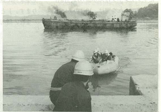
▶船舶の消火とゴムボートでの救出◀

午前9時、二里町八谷瀬の伊万里川を航行している土砂運搬船「南海丸」で火災が発生し、6人の乗組員が助けを求めているとの119番があり、待機中の消防車2台と救助工作車・大型救急車が現場に急行、消防車と巡視艇2隻が消火につとめるとともに、救助用ロープを伝ってのゴムボートによる救助訓練を行いました。