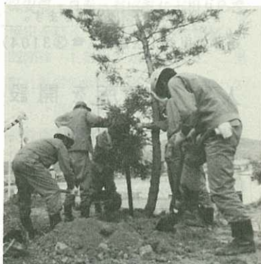
市の木「マキ」を移植す九電職員

市は、緑に包まれた豊かな住みよ いまちづくりを目指していますが10 月3日、九州電力伊万里営業所（松