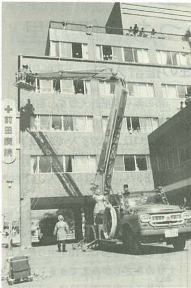
▶スノーケル車による救助◀

この訓練は、伊万里港に入港する大型貨物船の出入りがはげしくなったことと、市街地に店舗や住宅が密集し、アーケードや中高層ビルが多くなったことから、万一の火災に備えて、消防関係機関の緊密な連携いと消火・避難体制を確立するために実施したものです。