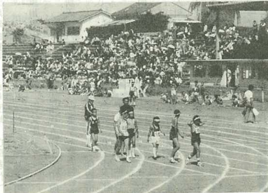
▶よい記録がたくさん出た陸上運動大会◀