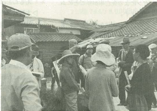
▶津上さんの説明に耳をかたむける参加者◀