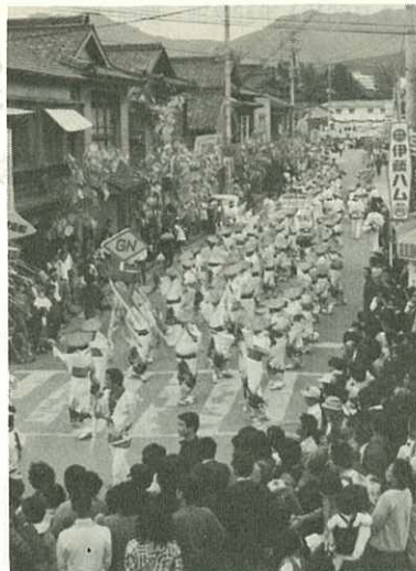
▶道いっぱい繰り出した踊り◀

婦は、「例年、10月22日から開かれていたトントンけんか祭りが、今年から土・日曜中心に開くことになり、収穫期にある農家にとっては祭り気分になれない。4日ぐらい早くとも思う人もあろうが、農家に