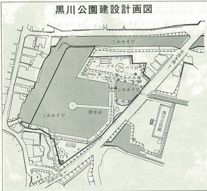
黒川公園建設計画図

は、ラセン式のすべり台やシーソー・鉄棒・ブランコなどの遊具施設を設け、湖の中心に行ける遊歩道を建設。来年3月に完成します。