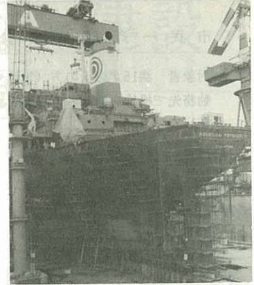
▶建造をいそぐ8万トンタンカー◀

将来は1,800人ぐらいになる予定で す。1年に8万トンから13万トン級 の中型船を4隻づつ建造し、海に浮 かぶ小島のような40万トンのタンカ ーも造る計画です。