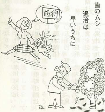
歯のムシ 退治は 早いうちに

こういう苦しみをなくすためには一日も早くムシ歯をなおすことです。そのためには、毎日歯をみがいてせいけつにしておくことがたいせつです。ムシ歯になっている人は一日も早く治療してなおさなければなりません。みんなの中には、ムシ歯をたくさんもっている人がいますがこれから一生使わなければならないだいじなものです。じょうぶで、ながもちするように、歯はいつもきれいにしておきましょう。