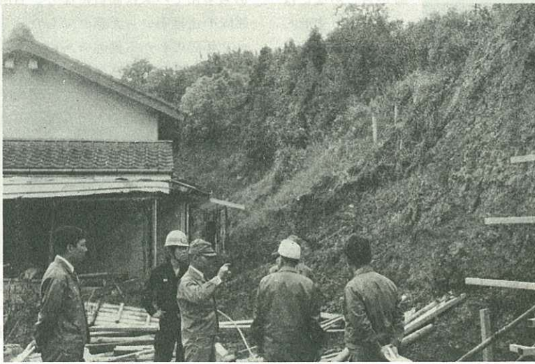
▶ 木須町馬伏の地割を視察する防災パトロール ◀

パトロールは、市をはじめ県や警察・消防署など防災機関が参加、地元民などから現地のもようを詳しく聞いたり、現地踏査してそれぞれの地区について対策を検討しました。