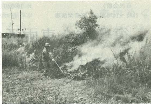
▶汗びっしょりの焼却作業◀

ゴミの不法投棄は、いぜんとしてあとをたちませんが、市保健衛生課は、さる6月13日、二里町八谷瀬の白幡鉄橋付近で上流から流れてきた積した種々雑多のゴミを火炎放射機3台を使って全身汗びっしょりになりながら、半日もかかってゴミの山を焼き払いました。