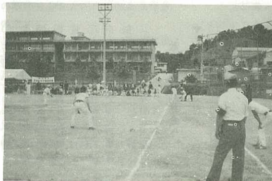
▶元気にプレーするチビッコ少年団◀

をしました。試合は、小学生と中学生にわかれ、日ごろの練習成果を十分に発揮していま