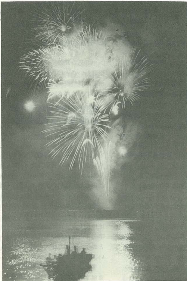
夏の夜空を色どり、市民の目を楽しませた伊万里河畔での花火大会