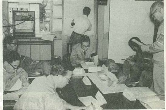
ことがたいせつです。

たるところにあります。実際に水害が発生すれば、情報が乱れとび正確な災害状況の掌握が困難になります。このようなことから、的確な防災対策が遅れ、災害を大きくすることから、万に備えたものです。