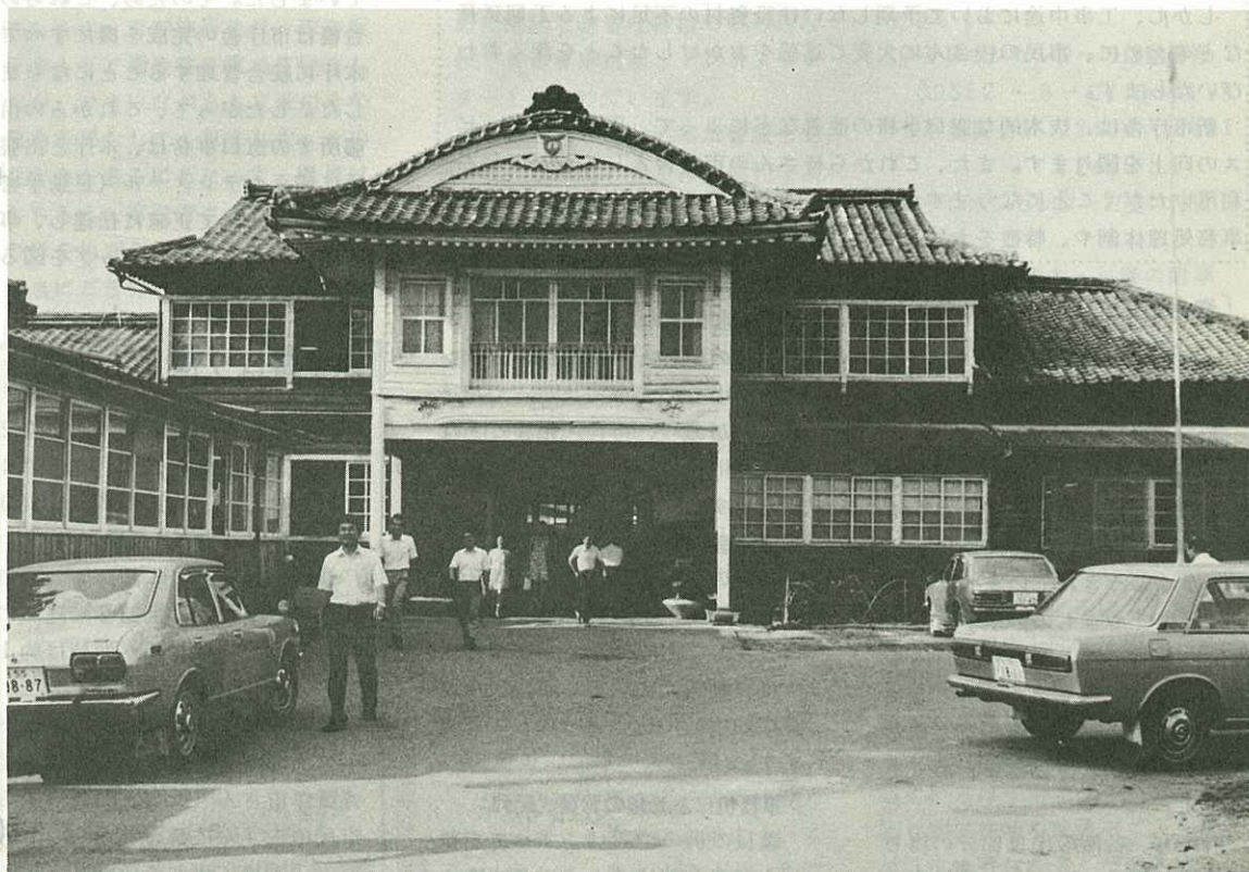
長い間ご苦労さまでした ( 48. 7. 26 撮影 )

昭和29年4月、伊万里市発足以来19年の長い間市の仮庁舎として使用してきた79歳の老舎は、立花台地に完成した新庁舎の開庁とともに長い勤めを終わることになりました。