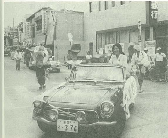
ミス港を乗せたオープンカーを先頭に、伊万里商工会 議所を出発し駅通りをねり歩く仮装行列の一行