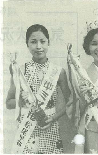
11人の応募者の中から、晴れの苗さん・ミス港西豊子さん・準ミ