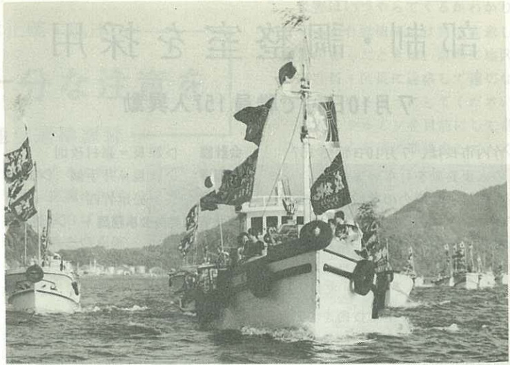
大漁旗をひるがえし、ミコシを乗せた母船を先頭に瀬戸町漁港から 伊万里に向けて航行する勇壮な船団パレード