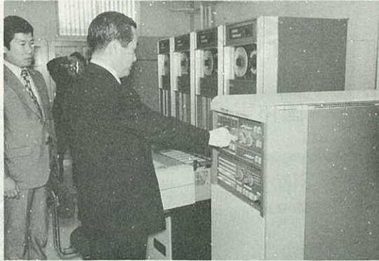
▶コンピュータのスイッチを入れる竹内市長◀

この電子計算センターは、全国でもめずらしく、佐賀県と長崎県の県境を越えた12市町村で建設したものです。