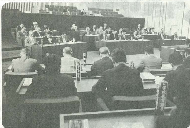
▶新しい議場で開かれた定例市議会◀