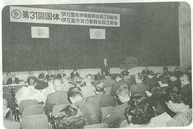
▶ 200人が出席して開かれた国体実行委員会設立総会 ◀

10月4日、市民会館で第31回国体の市準備委員会第2回総会、引き続いて同実行委員会設立総会が開かれました。