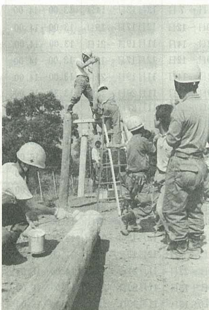
▶古い電柱で遊動円木をつくる九電の人たち◀

九州電力株式会社伊万里営業所は 九州電気工事株式会社伊万里出張所 と合同で、10月15日、祇園公園の一 角に、古い電柱でつくった遊動円木 と平均台を贈りました。