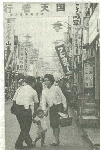
▷買い物客でにぎわう商店街<

現在年末年始の売り上げの状況や歩行者天国の実施時期・時間などについても調査しており、その結果にもとづいて歩行者天国の実施時期など再検討することになっています。