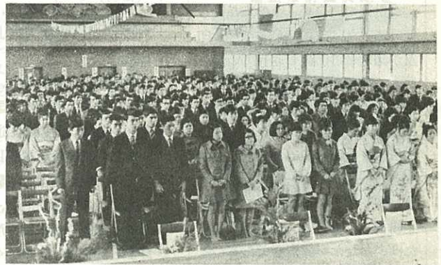
伊中体育館で行なわれた成人式

また、成人式を記念する恒例の中島榎争奪各町対抗団体マラソンは、山代町チームが連勝しました。