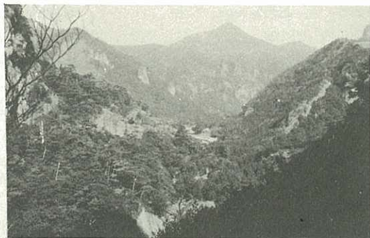
▷ダムが建設される竜門峡◁

水人口は176.6パーセント・給水量238.6パーセントと大幅に伸びています。昨年は、1日1人当たりの給水量も377リットルを記録し、施設の1日給水能力9,000トンを越え