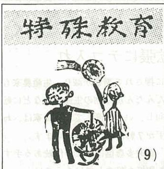
した児童・生徒に、積極的に関心を

当日は、九州各県をはじめ、中国四国地方からも関係者の参加が多いと思われます。わたしたちが、こう