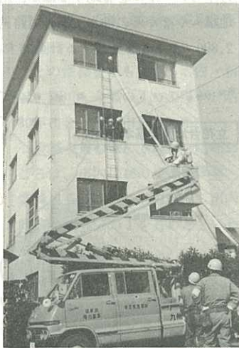
▷西肥バス寮での救出訓練◁

これから、日増しに寒さが厳しくなります。石油ストーブなどの取り扱いには十分注意しましょう。