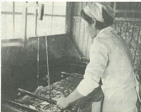
▷ 器用な手つきで紙をすく農家の主婦 ◁

いまのところ、年産5,000束を見込んでいますが、原料になるコウゾは、地元だけでは不足するため、東松浦郡の上場地区から調達することにしており、こんご販路開拓を図りながら、生産農家もふやしていくことにしています。