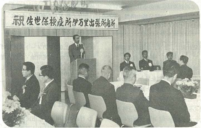
▽玉屋で開かれた検疫所の開所式△