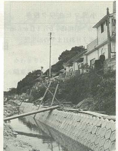
▷工事が始まった岩栗橋付近<

工事は、48年までかかる予定ですが、ことしは、伊万里中学校のちかくからはじめ、じゅんじゅんに川し