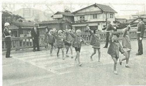
▷道路横断のしかたを勉強する大坪保育園児<

ことし9月30日までの9か月間におこった交通事故は、399件（死者10人・傷者406人）にのぼり、なかでも子どもや老人の事故は、死者3人・傷者59人で、高校生の事故も多く、死者3人・傷者16人の事故者をだしてい