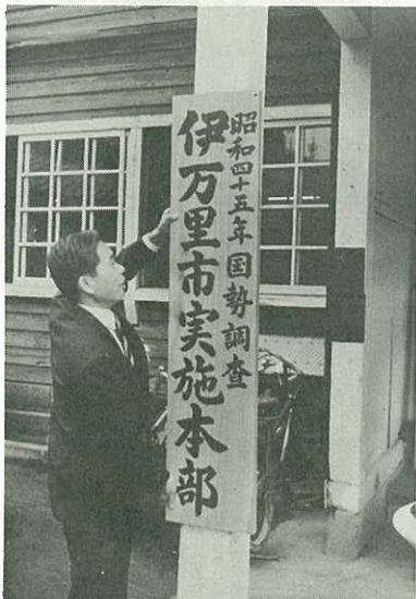
▷市役所に設けた国調実施本部の看板<

10月1日は、国勢調査の日です。 この調査は、わが国の人口や世帯構成などを明らかにし、国県はもちろん、地方交付税の算定など市行政