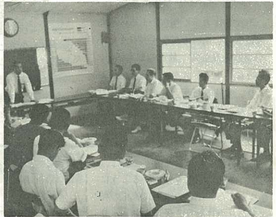
▷市政運営に意見を述べるモニター会議